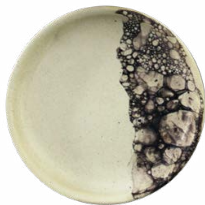
Plato 16 cm 20 cm