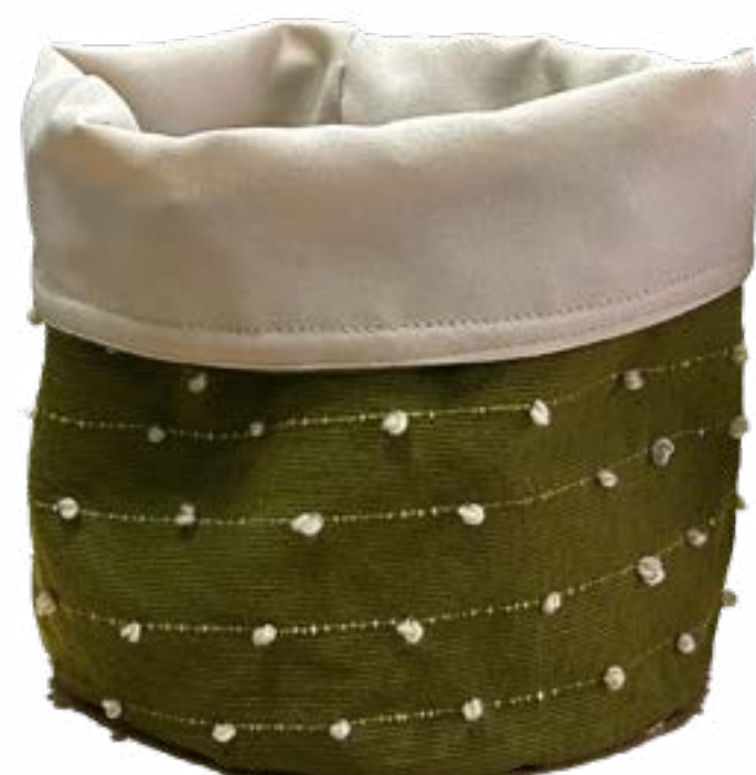
Oliva 20 x 20 cm