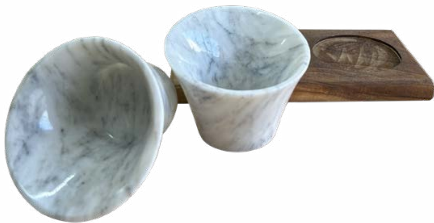
Ramekin 5 x 7 cm