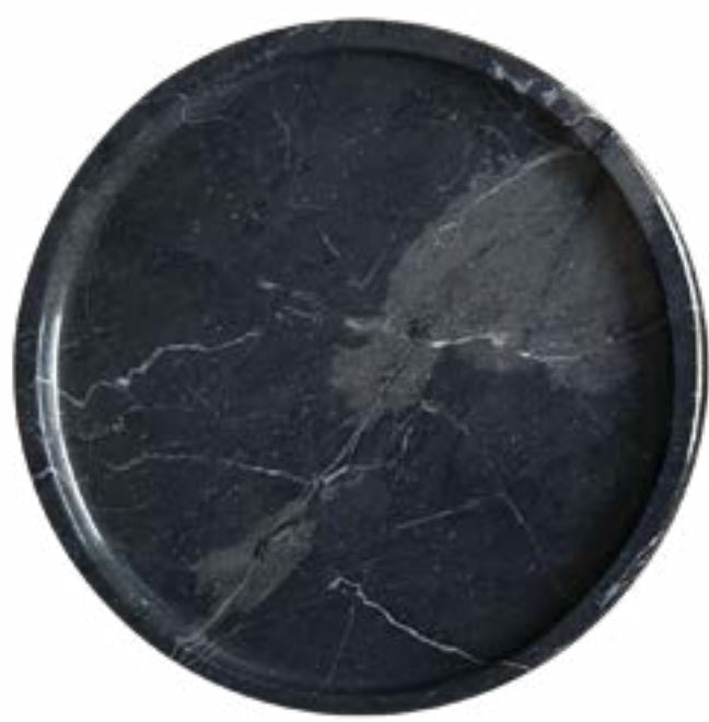
Sombra 20 x 2 cm