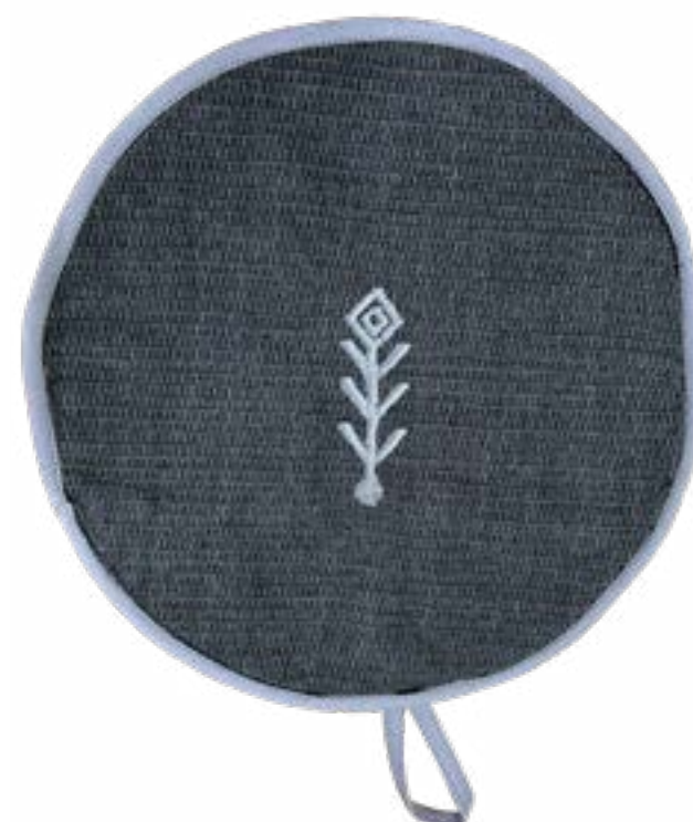
Ceniza 24 cm