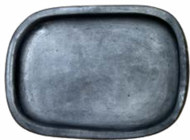
Nido 18 x 13 cm