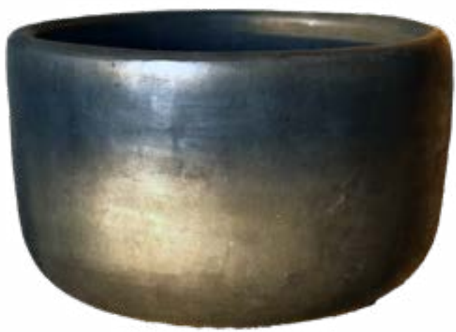
Tazón 14.9 x 9 cm