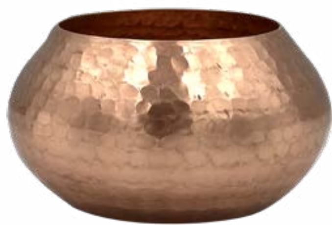
Natural 8.5 x 5 cm