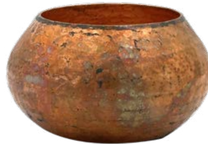
Óxido 8.5 x 5 cm