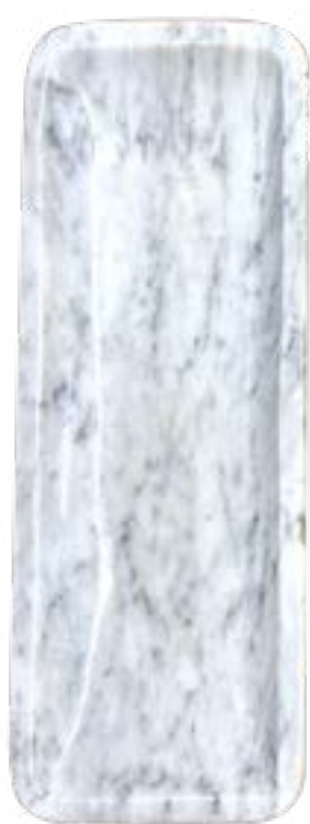
Clara 25 x 9 cm