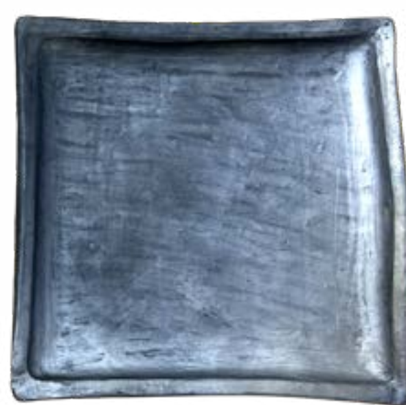
Sendero 17 x 17 cm