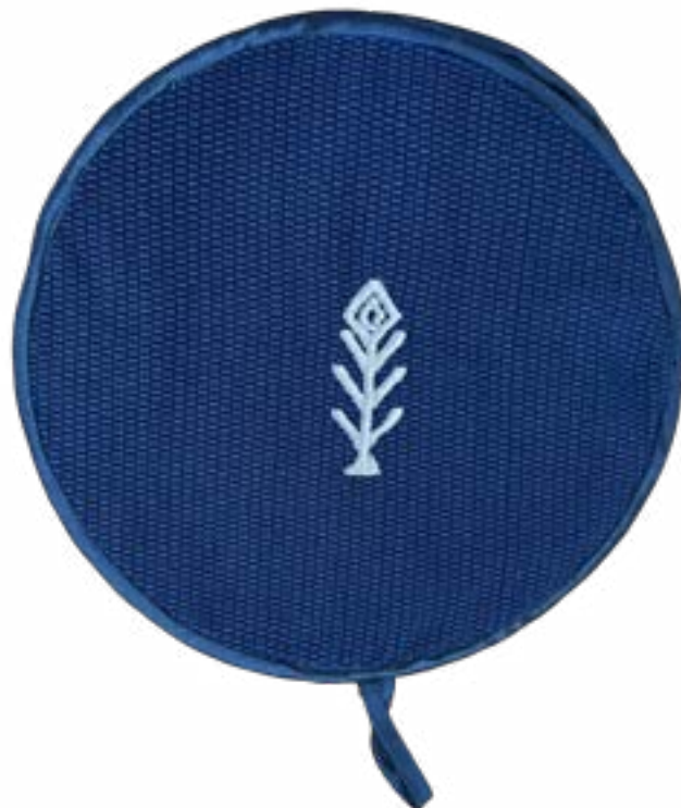
Nixtamal 24 cm