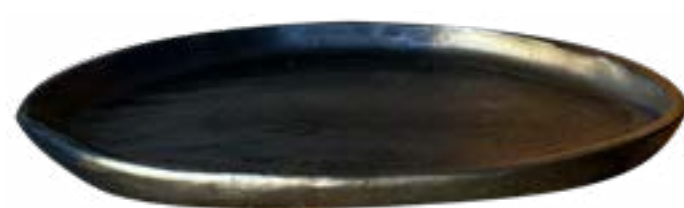
Plato largo 34 x 22 cm