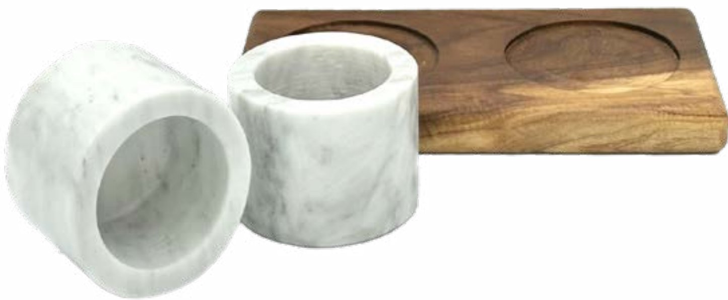
Ramekin 5 x 7 cm