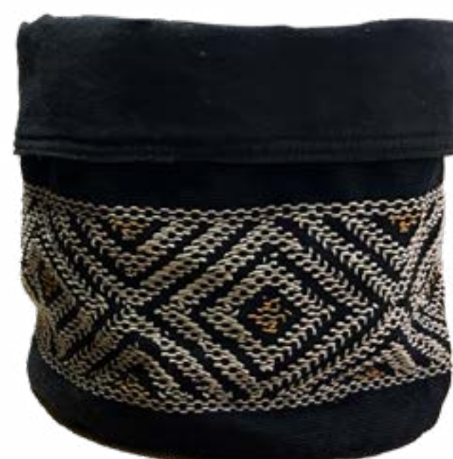
Cacao 20 x 20 cm