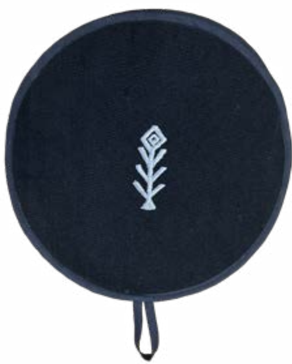
Totomoxtle 24 cm