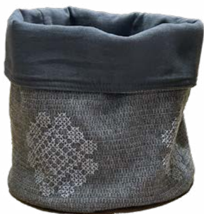
Ceniza 20 x 20 cm