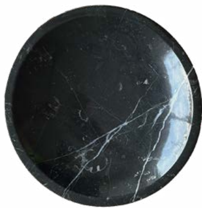
Sombra 18 x 3 cm