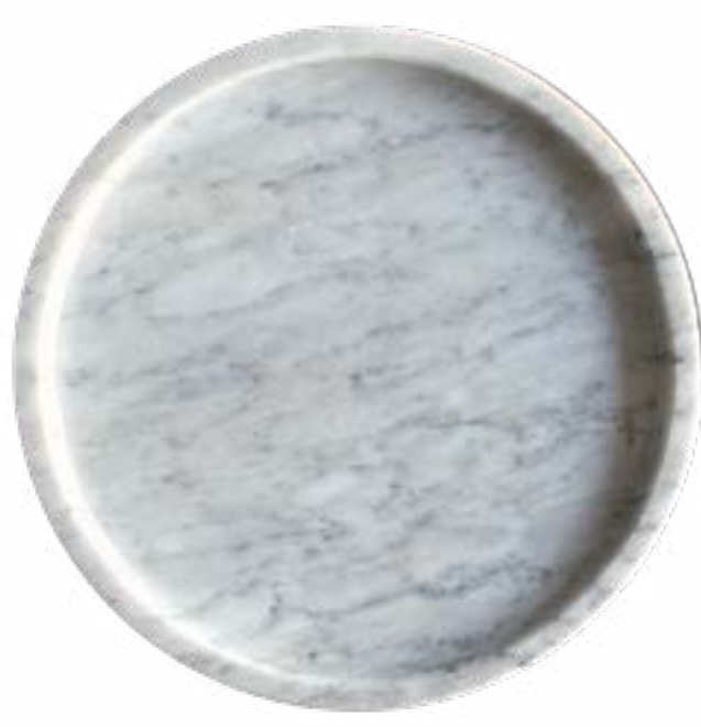
Nieve 20 x 2 cm