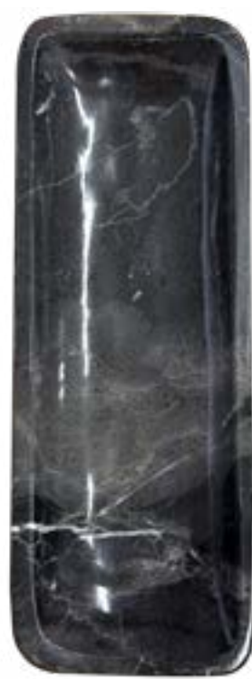
Obsidiana 25 x 9 cm