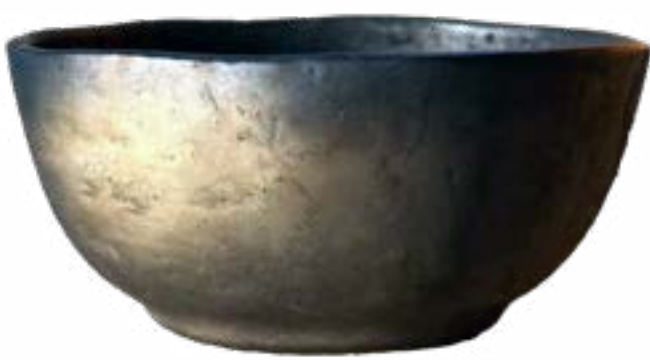
Bowl 18 x 8.5 cm