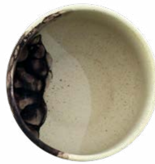
Tazón 13 cm