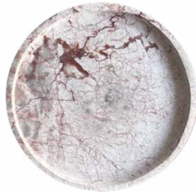
Tierra 20 x 2 cm