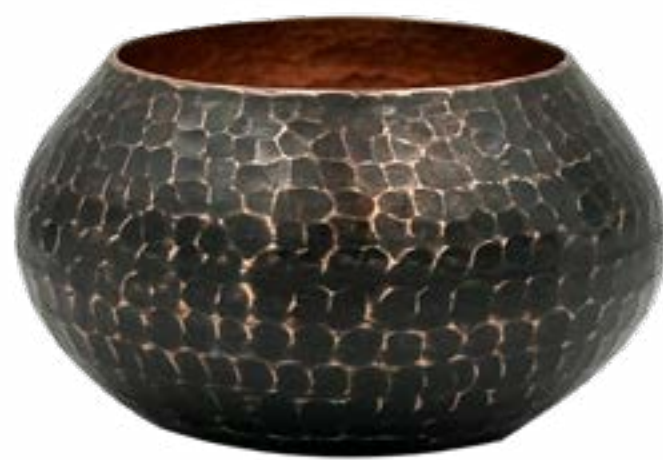
Negro 8.5 x 5 cm