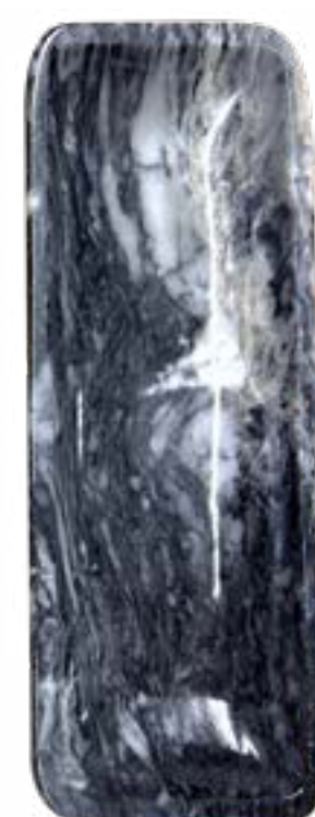
Humo 25 x 9 cm