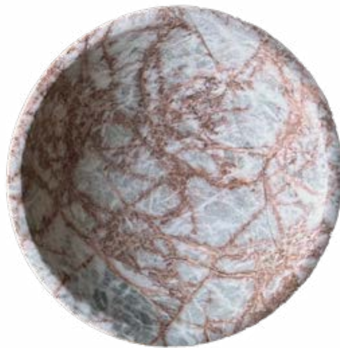
Tierra 18 x 3 cm